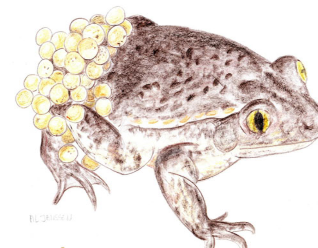
Crapaud alyte (aquarelle) Alytes obstetricans Vroedmeesterpad (aquarel)