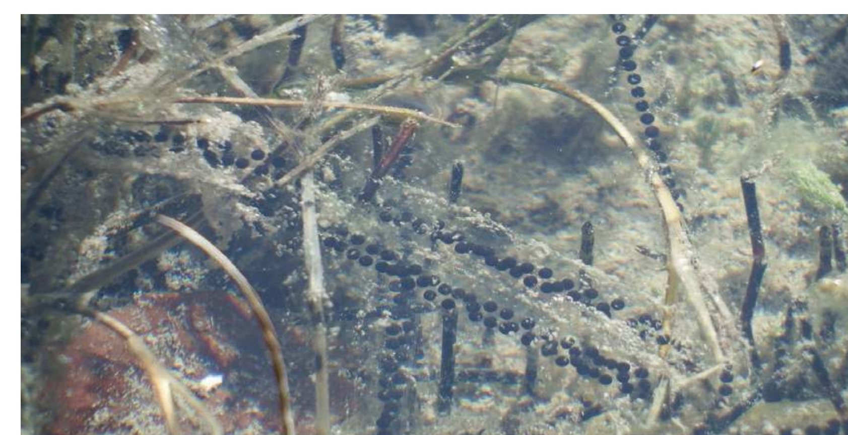
Ponte de Crapaud commun Bufo bufo Eiklomp van gewone pad Bufo bufo