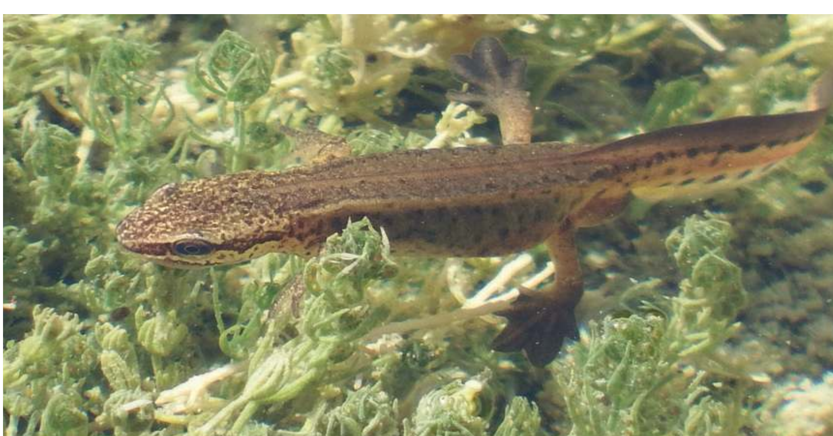
Triton palmé Triturus helveticus Vinpootsalamander