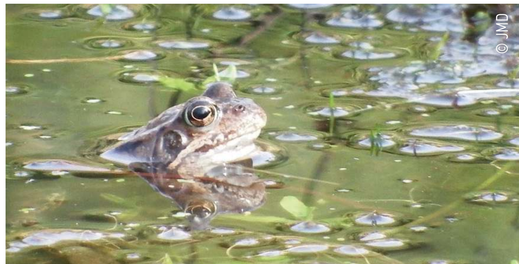
Grenouille rousse Rana temporaria Bruine kikker

Door de poelen van Goiveux stroomt vers, zuurstofrijk water. Het wordt gefilterd door de rotsen en loopt dan langzaam verder naar twee irrigatiekanalen. Zo ontstaat een vochtige zone die bij heel wat insecten in trek is. Kranswieren zijn de jongste voorouders van bloemplanten. Ze zijn vrij zeldzaam, houden van alkalisch water met weinig stikstof en zijn een indicator van de goede kwaliteit van dit oppervlaktewater.