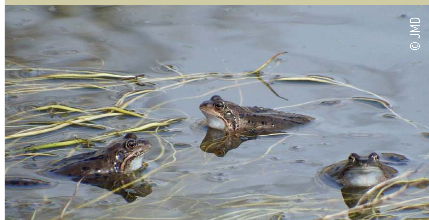
Grenouilles rousses Rana temporaria Bruine kikkers