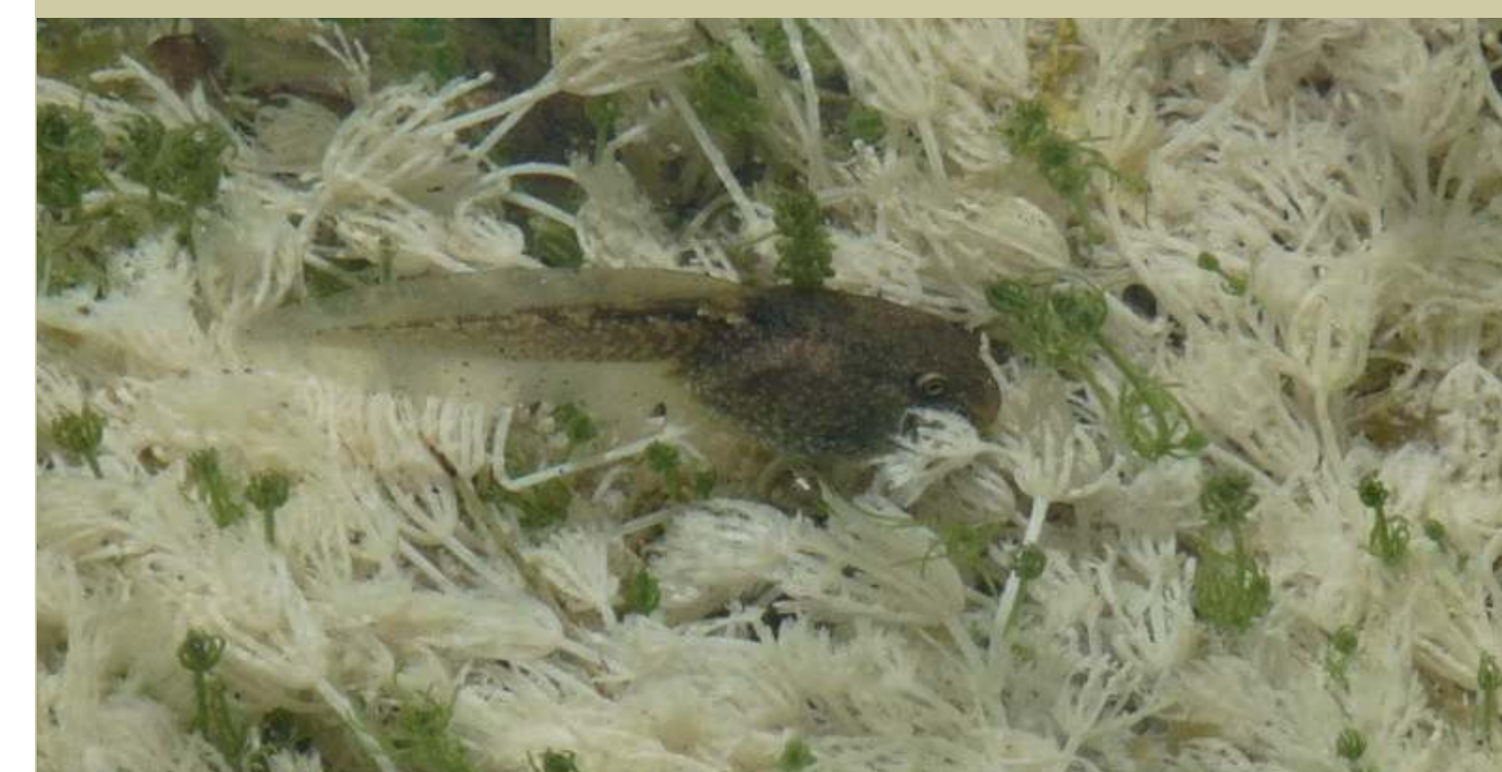
Têtard de Crapaud accoucheur Alytes obstetricans Vroedmeesterpad