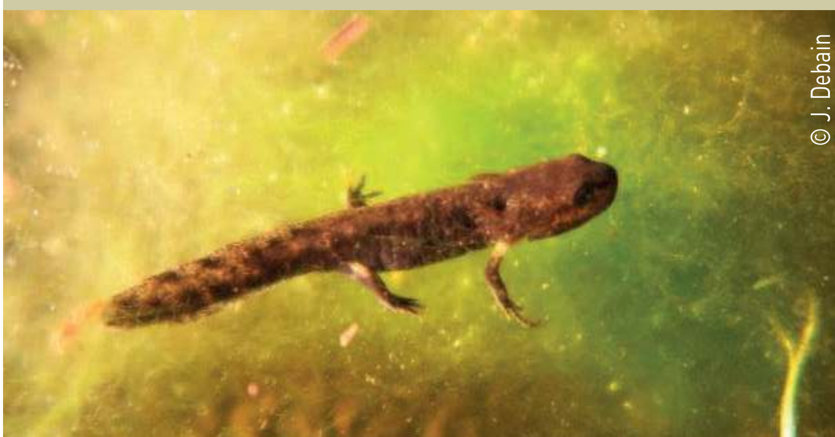
Larve de Salamandre Salamanderlarve