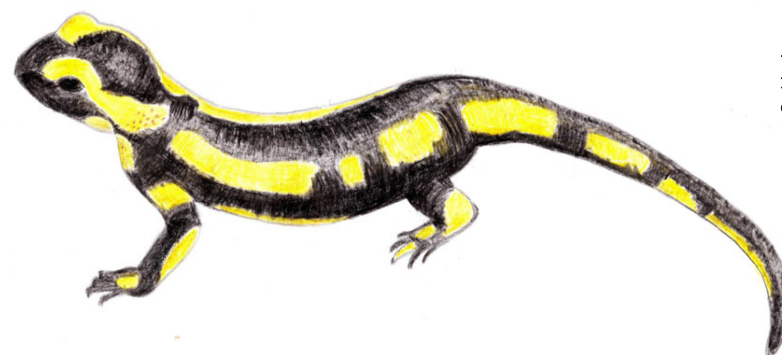
Salamandre (aquarelle) Salamander (aquarel)