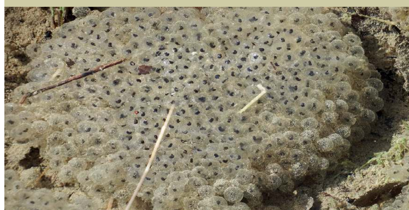
Ponte de Grenouilles rousses Eiklomp van bruine kikkers